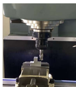
図2 フライス盤作業

加工を行うにあたり、既存のマシンバイスでクランプできる材料の大きさが限られる等、制限が多かったため治具を製作する等して対応した。