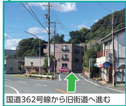
国道362号線から旧街道へ進む