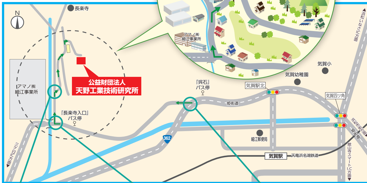
公益財団法人 天野工業技術研究所