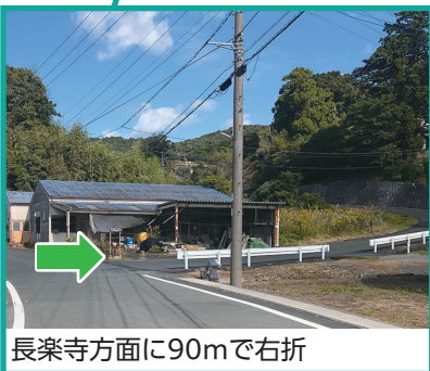
長楽寺方面に90mで右折