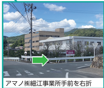
アマノ(株)細江事業所手前を右折