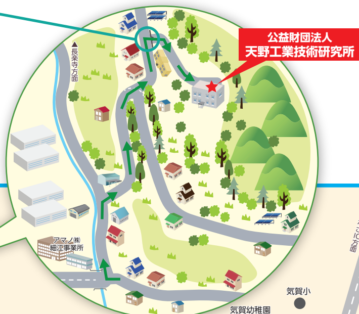
公益財団法人 天野工業技術研究所