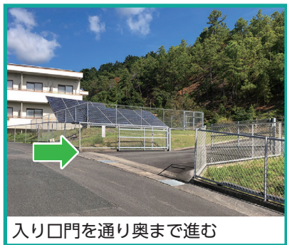
入り口門を通り奥まで進む